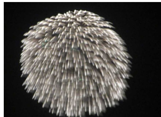
北関東唯一の3尺玉(直径約650m)も