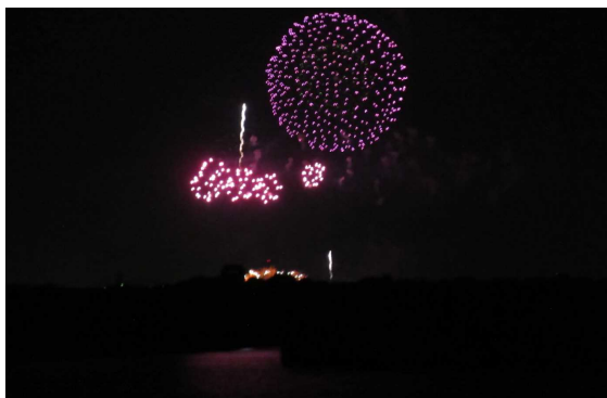
花火の明るさで調整池の水面が浮かぶ