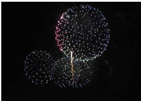
約1時間の間に約2万発の花火