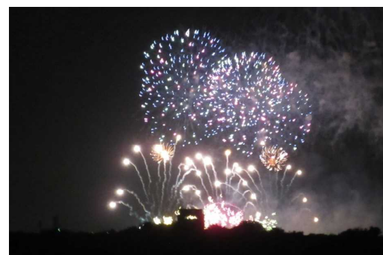
第2水門の上空に次々と打ち上がる花火