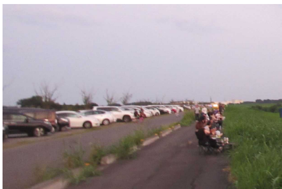
堤防上には大勢の見物人が詰めかけ

令和6年8月3日(土)の夜、茨城県古河市の花火大会が5年ぶりに通常開催され「生井桜づつみ」から第2調節池を隔て、対岸の花火を間近に見ることができました。