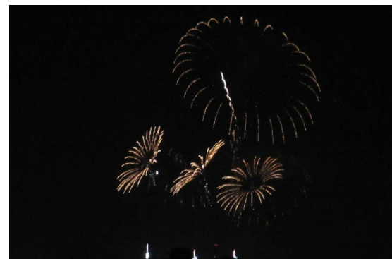
3軒の花火業者による競演