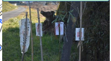
⑧小字追切と小字折本との境