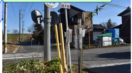
⑩小字本宿と大字乙女方面との境