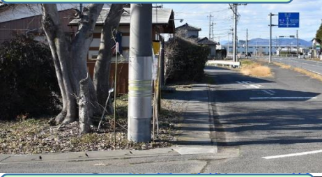
⑥小字追切と大字寒川方面との境