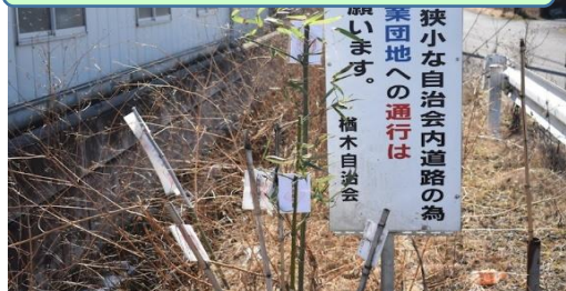
③大字榑木と大字生良方面との境