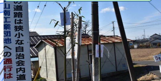
④大字榑木と野木町大字友沼との境