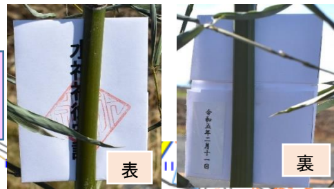
②大字榑木と大字網戸小字本宿との境

令和5年2月11日(土)、渡良瀬遊水地にほど近い小山市大字榑木地区の辻(昔の村の境界や道路が交わる場所)に水神社のお守り札をはさんだ青竹が立てられました。