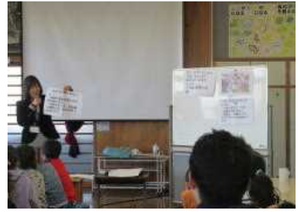
学校栄養士さんによるクイズとお話