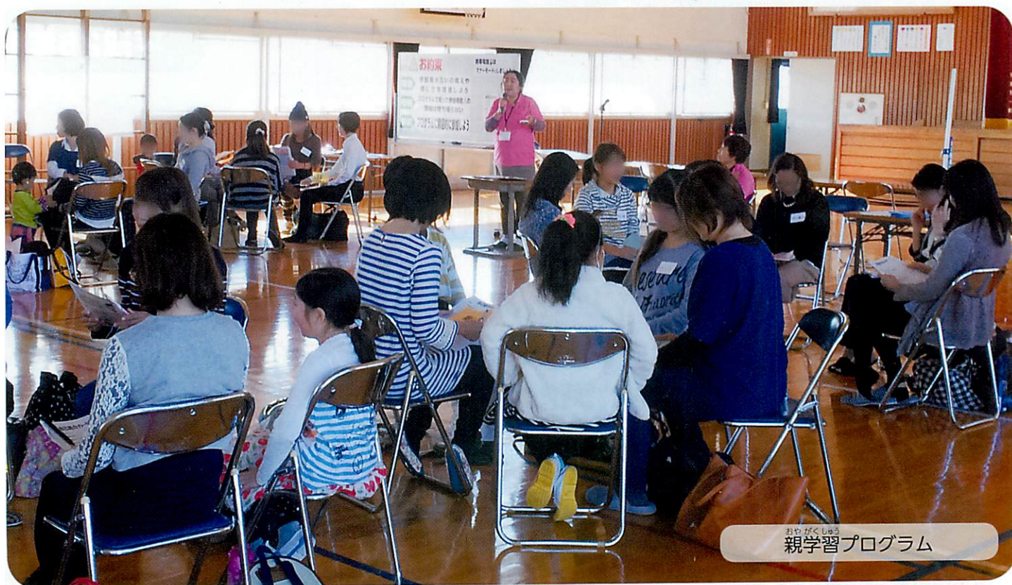
おやがくしゅう 親学習プログラム

この写真は、4月に小学生になる子どもをもつ 保護者の皆さんが、「親学習プログラム」を受講し ているところじゃよ。子育てに役立つコミュニケー ションを楽しそうに学んでおるじゃろ。