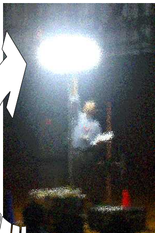
バルーン式の ライトです

合同の避難訓練を実施してみて、中学生が地域の小学生のために十分役割を果たせることがよくわかりました。今回の反省を絹中、梁小、福良小と共有し、次年度に生かしていきたいと思っています。