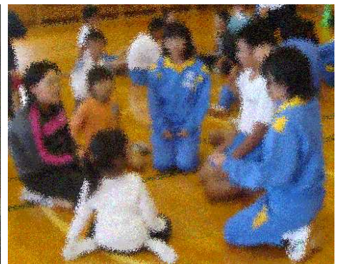
中学生と 仲良く活動しています