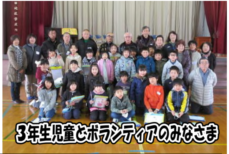
3年生児童とボランティアのみなさま